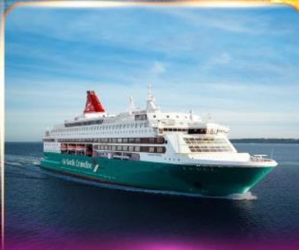
เรือสำราญ GO NORDIC CRUISE LINE