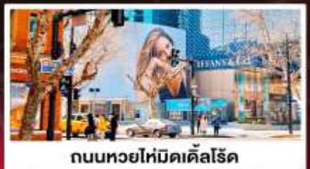
ถนนหยอไห่มีดเคิลโรด