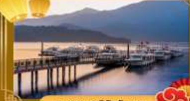
ทะเลสาบสุริยอันจินทรา