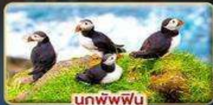
นกพิฟฟิน

📅 เดินทาง : 30 เม.ย. - 07 พ.ค. | 23-30 ก.ค. 69