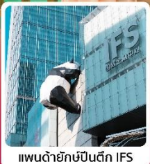
แพนด้ายักษ์ปิ่นตึก IFS