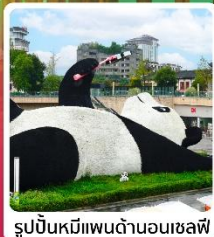
รูปปั้นหมีแพนด้าอนุเชลฟ์