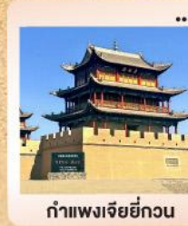
กำแพงเจียอี้กวน