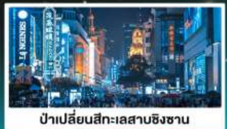
ป่าเปลี่ยนสีทะเลสาบชิงชาน