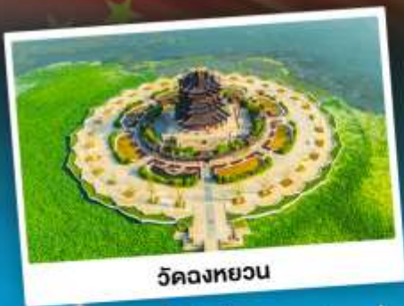
วัดทองยวน