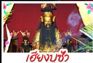
เอียงบูชิว