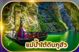
แม่น้ำใต้ดินกุ้ยโจว