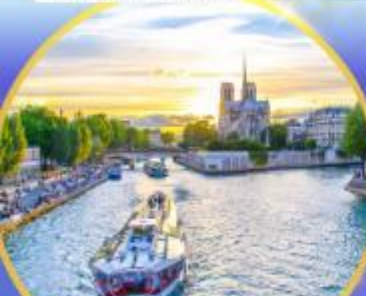
ล่องเรือแม่น้ำเซน