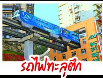
รถไฟทะลุคิก