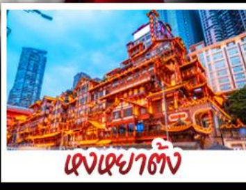
แองแองตัง