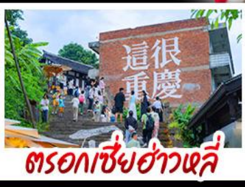
ตรอกซี้ยฮ่าวหลี่