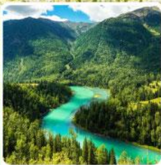
ทะเลสาบคานาสี