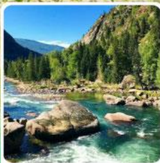
อุทยานเคอเคอทั้วไห่