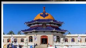
สุสานเจกิสข่าน