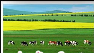
ทุ่งหญ้าฮอร์ดอส

ทุ่งหญ้าฮอร์ดอส สุสานเจกิสข่าน แกรนด์แคนยอนแม่น้ำเหลือง