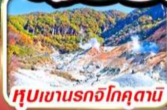
หุบเขานรกโจคุตามิ

รวม ค่าภาษีที่ปรับขึ้นแล้ว (ประกาศ 1 เม.ย. และ 26 พ.ค. 69)