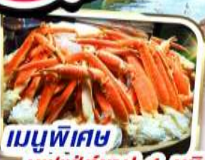
เมนูพิเศษ บุฟเฟ่ต์ซาปู 1 ชนิด

ราคาเริ่มต้น 31,999 *รวมภาษีสนามบินแล้ว*