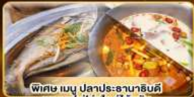
พิเศษ เมนู ปลาประ-ฮานฮินคิ ชาบูบุฟเฟ่ต์สไตล์ไต้หวัน