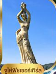
จูไห่ฟิชชอร์ทิวรา