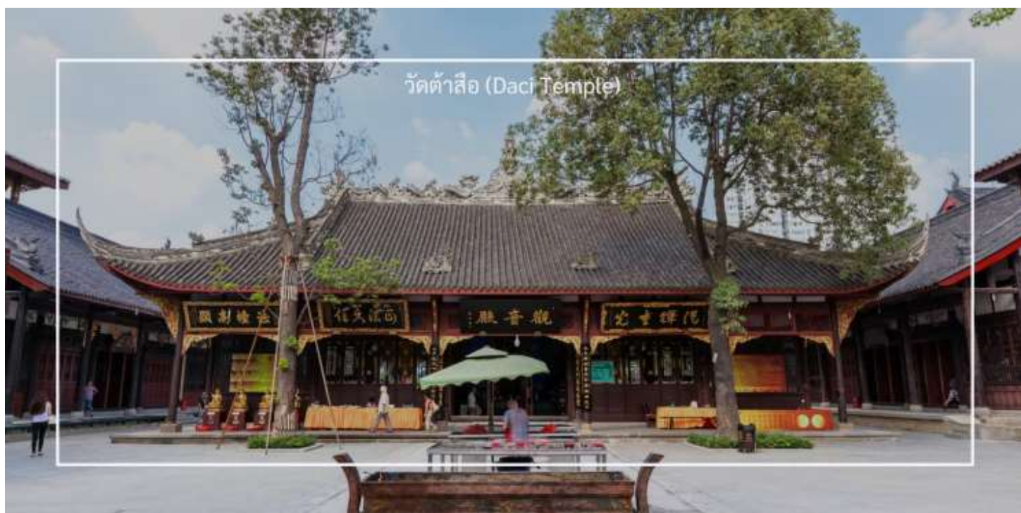
วัดต้าซือ (Daci Temple)