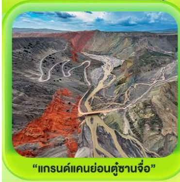
"แกรนด์แคนยอนคู่ชานโจว"

ซินเจียงเหนือ ทะเลสาบไซลีมู่ "น้ำตาหยดสุดท้ายของแอตแลนติก" • ทุ่งหญ้านาราภิบาล ทุ่งดอกไม้เทียนซาน • ผ่านชมสะพานกั๋วจื่อโกว • ถนนหลิวซิงเจียง • ตลาดต้าปาจา