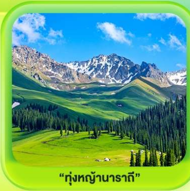
"ทุ่งหญ้านาราภิบาล"