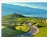
กุเซาวันเซียงซาน