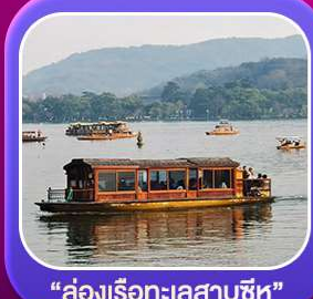
“ล่องเรือทะเลสาบซีหู”