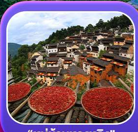
“หมู่บ้านหวงหลิง”

หุบเขาเทวดาวังเซียนกู่ หมู่บ้านที่ตั้งอยู่ริมหน้าผา • หมู่บ้านโบราณหวงหลิง ป่าสนน้ำชิงซาน • ล่องเรือทะเลสาบซีหู • ถนนโบราณตุ๋นโจว • ชมแสงสีที่ ฉู่หนี่โจว