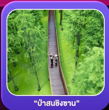
“ป่าสนชิงซาน”