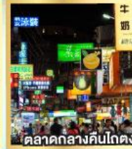
ตลาดกลางคืนโกตง