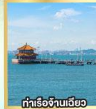
ท่าเรือจันทิว