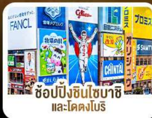
ช้อปปิ้งชินไซบาชิ และโดตงโบริ