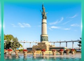
อนุสาวรีย์มังกร