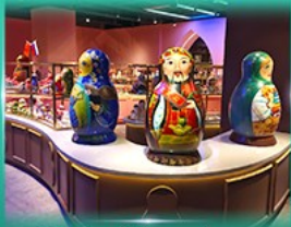
พิพิธภัณฑ์ ตุ๊กตาแม่ลูกดก