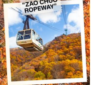
"ZAO CHUO ROPEWAY"

วันเดินทาง 30 ต.ค. - 5 พ.ย. 2569 4 - 10 พ.ย. 2569