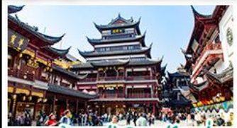
ตลาดร้อยปีเฉิงหวงเมี่ย