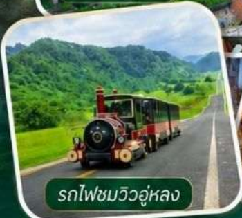
รถไฟชมวิวอู่หลง