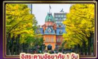
ฮิโระ-ตามฮิโรคิ 1 วัน