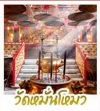
วัดเมื่อนไทมว