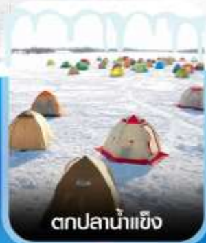
ตกปลาน้ำแข็ง