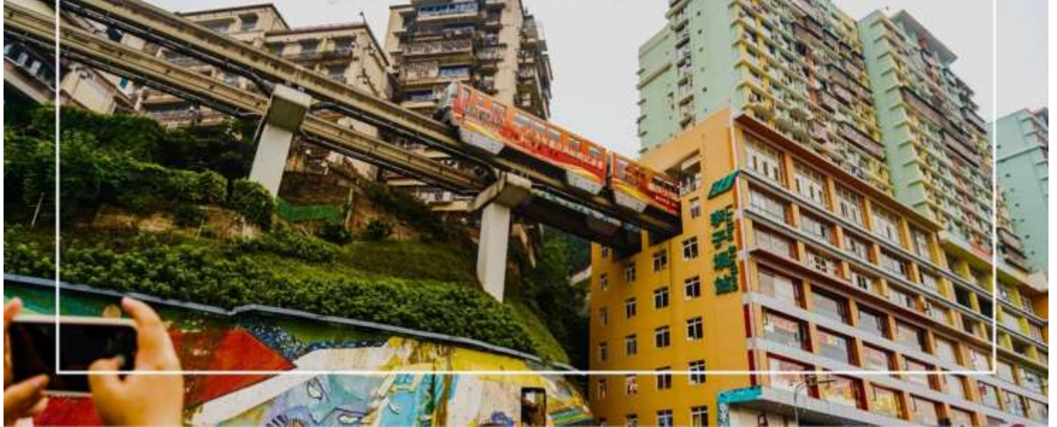
รถไฟฟ้าลัดราง สถานีลิซ่า (Monorail train Liziba Station)