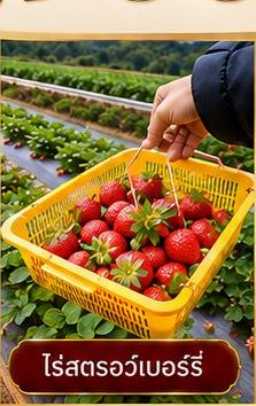
ไร่สตอร์วเบอร์รี่