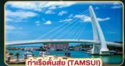
ท่าเรือตันซู่ (TAMSUI)