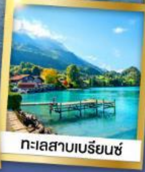
ทะเลสาบเบรียมันซ์