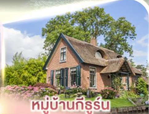
หมู่บ้านทีร์ซุน