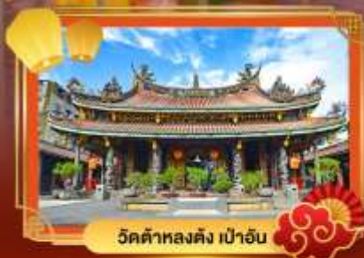
วัดต้าหลงตง เป่าอัน